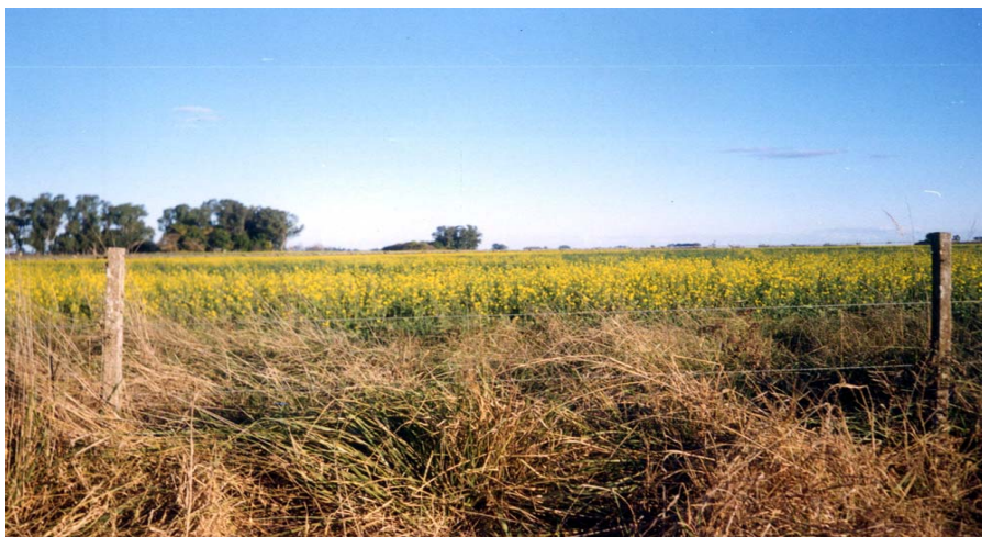
Foto 2: Floración natural de Brassica napus a fines de Julio. (P.Crespo-San Sebastián-7/05)

La Opción B que; entre otras especies ; tiene a la Alfalfa es la preferida por las abejas en condiciones normales de pecoreo.