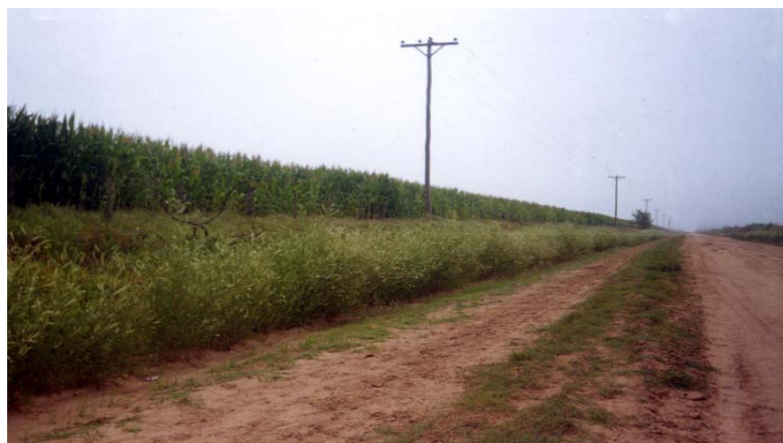
Foto 3: Floración natural de Melilotus alba, Febrero de 2005. (P.Crespo San Sebastián 2/05 )